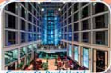
Grange St. Pauls Hotel